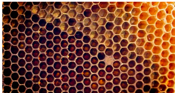
Le siège administratif d'Harmonie Mutuelle en région Centre-Île-de-France, à Orléans, favorise la sauvegarde des abeilles en abritant des ruches sur son toit.