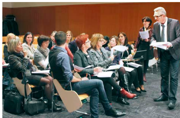
Les collaborateurs d'Harmonie Mutuelle réunis à l'occasion d'un séminaire en région Atlantique.

Au-delà des négociations annuelles obligatoires (NAO), les négociations sociales portent sur des sujets divers sortant du cadre des obligations légales : accord de dialogue social – avenant n°1 à l'accord de convergence ; accord dispositif migration informatique. Un accord handicap, validé à l'unanimité par les partenaires sociaux et d'une durée de trois ans, concrétise l'engagement de mettre en œuvre une politique volontariste en matière de soutien aux collaborateurs en situation de handicap. L'objectif est de favoriser le recrutement et le maintien dans l'emploi des salariés handicapés.